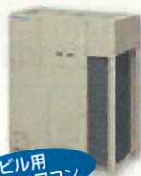
ビル用 マルチエアコン