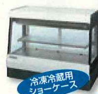
冷凍冷蔵用 ショーケース