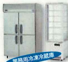
業務用冷凍冷蔵庫